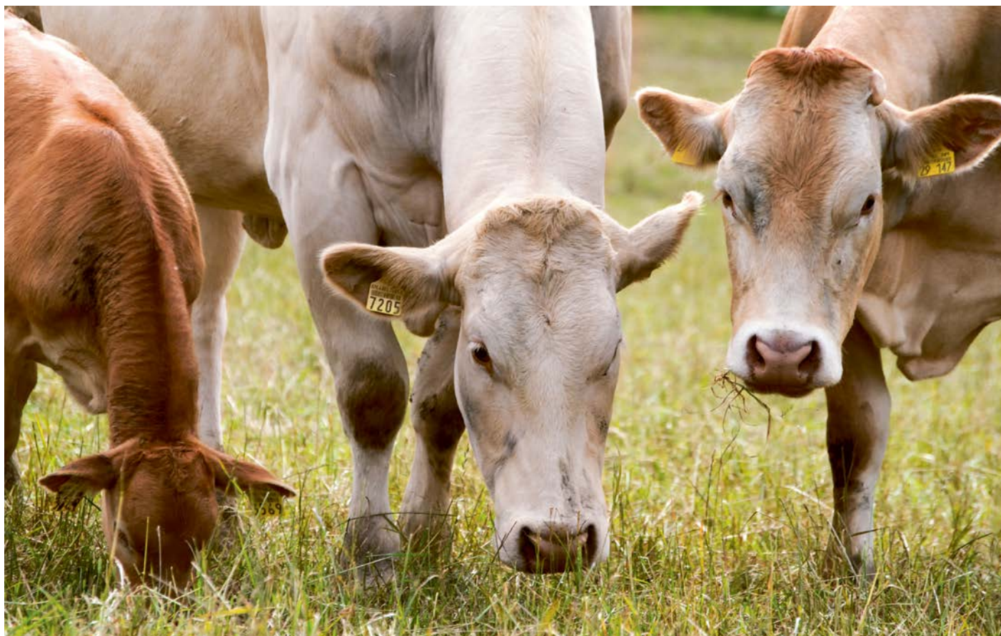
La médecine complémentaire fait aussi son entrée dans l'élevage allaitant.

L'aromathérapie est une médecine utilisant les propriétés spécifiques des plantes aromatiques concentrées dans les huiles essentielles. Le but de cette médecine n'est pas de soigner les symptômes directs d'une pathologie, mais de stimuler l'organisme de manière globale pour donner toutes les chances à l'animal de pouvoir résister à la maladie et de le soutenir lorsqu'il est vulnérable pendant les périodes à risques. En effet, les plantes ont le pouvoir de stimuler les fonctions physiologiques du corps et l'immunité. De plus, elles fonctionnent sous forme de synergies, la combinaison de plusieurs plantes permettant d'intensifier l'action recherchée. L'aromathérapie